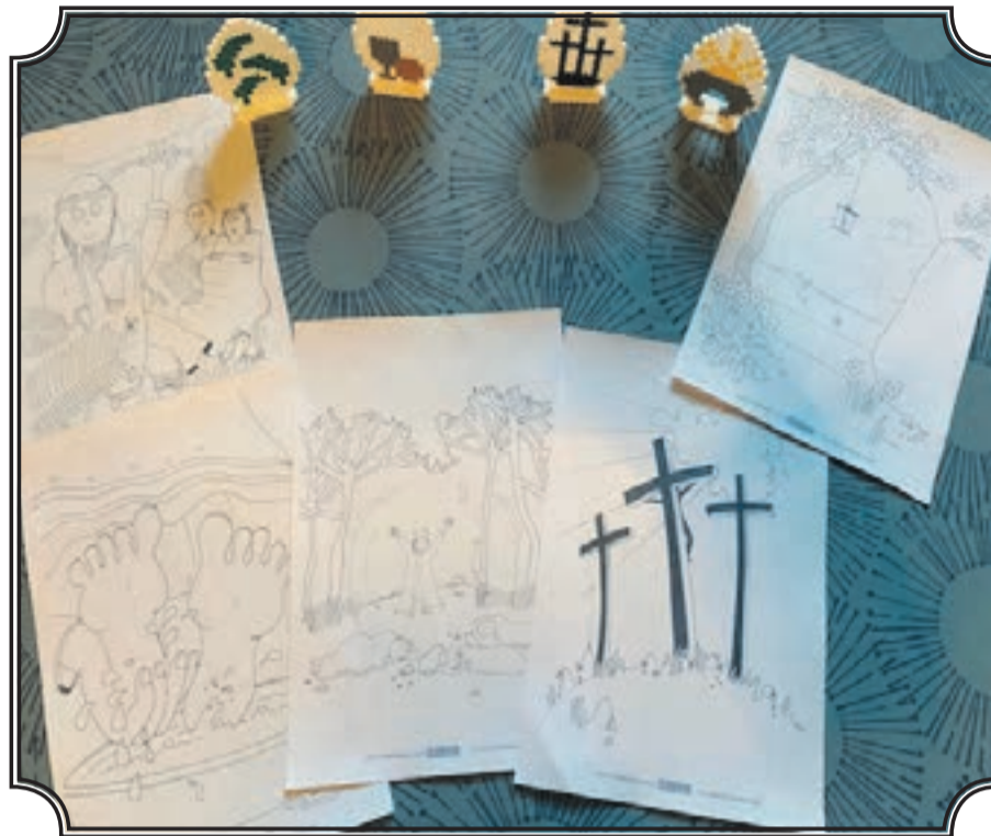
Kirken er åben, velkommen

Onsdag d. 14. maj og d. 18. juni kl. 18.30